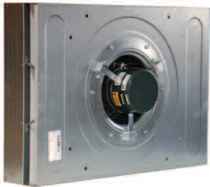
Caisson de filtration avec vue sur ventilateur