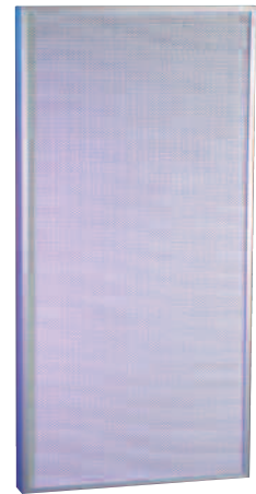
Filtre absolu H14