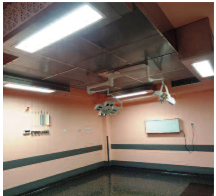
PSX 24/24 - Structure inox - Bloc opératoire

Le flux laminaire vertical crée une zone en surpression garantissant un environnement en milieu stérile (classe ISO 5).