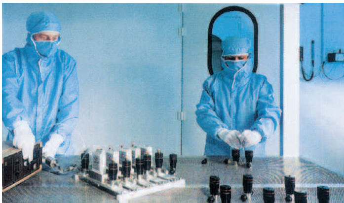
Plan de travail perforé sous PS - Industrie micro-mécanique