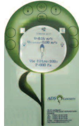
Tableau de commande (voir plaquette détaillée)