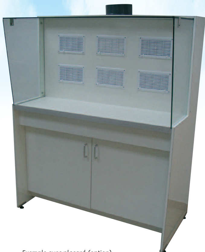
Exemple avec placard (option)

Les postes de type T sont destinés à protéger le manipulateur et son environnement proche grâce à un système d'extraction vers l'extérieur. De construction en matériaux non générateurs de particules, ils peuvent être installés directement en salle blanche . L'optimisation des dimensions leur permet de s'intégrer dans tout type de laboratoire bas de plafond .