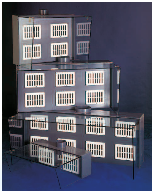
Les différentes hottes de type T standard