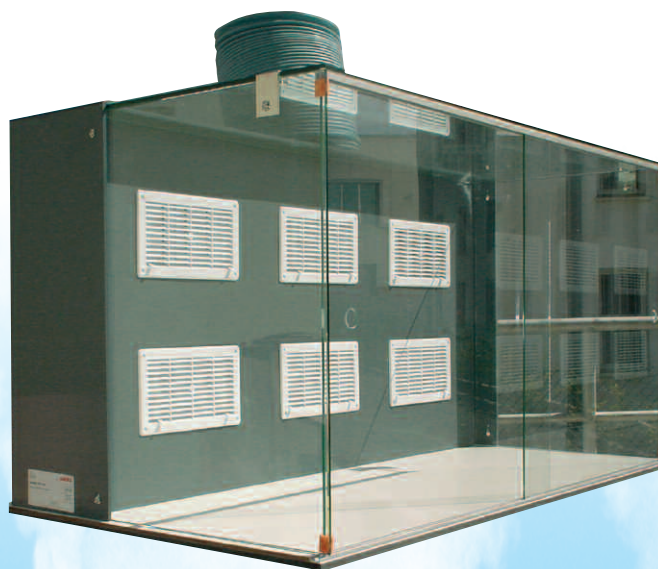
T83 avec casquette spéciale (option)

MISE EN SERVICE ET MAINTENANCE ASSUREES PAR LE CONSTRUCTEUR ADS LAMINAIRE